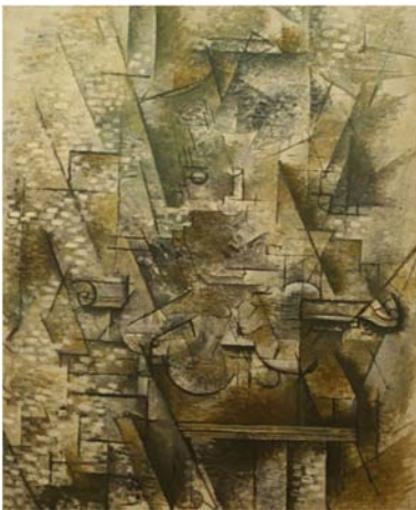
Picasso, Le Guitariste , 1910, Musée Beaubourg.

En collaborant aux Ballets Russes de Serge de Diaghilev, Picasso va profondément bouleverser l'esthétique chorégraphique d'une troupe qu'incarnait la virtuosité et l'agilité d'un Nijinsky. Les costumes de Parade , ballet de Cocteau représenté le 18 mai 1917, sur une musique de Satie, marqueront particulièrement les esprits ; En effet, ces personnages imposants, aux corps fracturés, qui organisent la réclame devant un chapiteau de cirque paraissent tout droit sortis d'un tableau du maître cubiste et rappellent Le Guitariste (1911) ou L'homme avec une pipe (1914).