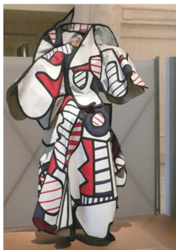
Personnage de Coucou Bazar , Musée des Arts Décoratifs, Paris, 2013

Les danseurs sont entourés d'une quinzaine de découpes figurant des personnages (homoncules, animaux ou végétaux) et manipulées par des machinistes ; tantôt ce sont les découpes qui effectuent les mouvements, tantôt ce sont les acteurs. Les costumes sont d'abord préparés par le peintre sur du papier armé et peint que reproduisent des tôleiers en une tôle d'aluminium sur lesquels les couturières mouleront des tarlatanes amidonnées, « afin que pour finir des danseurs hideusement masqués s'en harnachent de la tête au pieds et se trémoussent devant de grands décors peints à cette fin ». 4 La même année, Joan Miro participe à la création de Mori el Merma , une adaptation d' Ubu Roi , avec la troupe La Claca, et il prépare à cette occasion des costumes en tissu et carton aux formes audacieuses, bosselées et gélatineuses en utilisant des couleurs vives et tranchées.